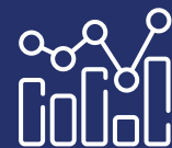
Métricas y Estadísticas