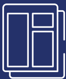
Plantillas de documentos