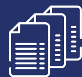
Funcionalidad de expedientes