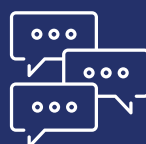
Comentarios y Colaboración