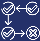
Flujos de aprobación configurables