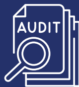
Auditoría de documentos