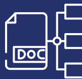
Documentos Relacionados y Anexos