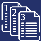
Control de versiones