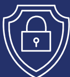
Roles y Permisos