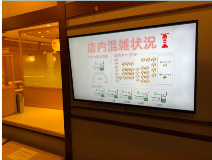
[店頭モニター設置例]