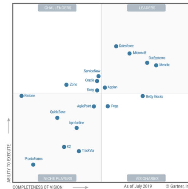
Figure 1. Magic Quadrant for Enterprise Low-Code Application Platforms

Gartner ha reconocido a Microsoft como líder en plataformas de aplicaciones empresariales de bajo código