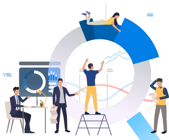
Tableau de bord puissant

Suivre la progression de vos utilisateurs dans l'adoption de nouveau services digitaux et agir en conséquence en produisant de nouveaux exercices/cours personnalisés à votre entreprise