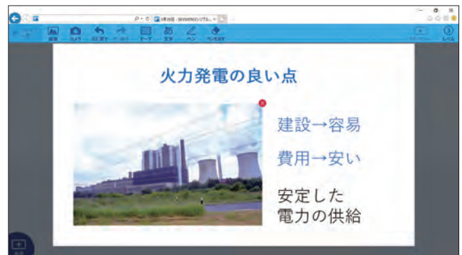
シンプルプレゼン