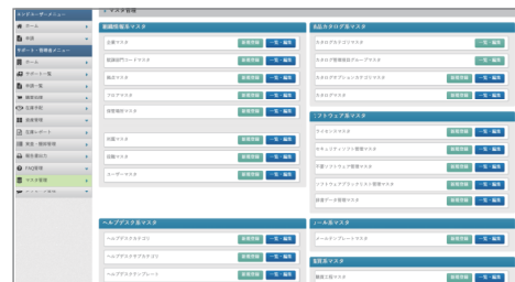
コンソール画面(自由設計)