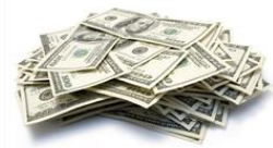
Vad vill vi?

Vad är optimalt? Red Pine föreslår bästa möjliga kommunikationen utifrån tre aspekter: historisk kunddata, vad som händer i det specifika mötet i realtid och vad som är mest lönsamt för verksamheten.