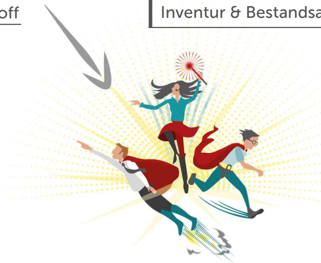
Optional: Zielgruppen-Workshops & Interviews