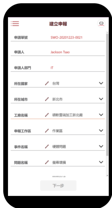
行動化 即時申報案件