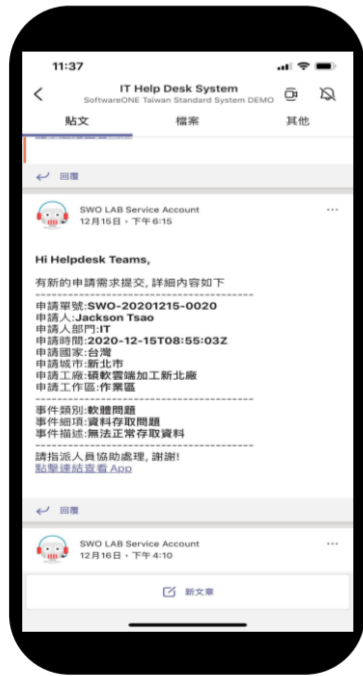
自動推送 即時溝通