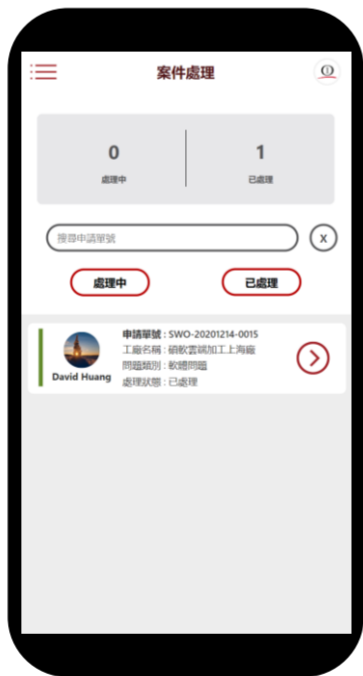
案件指派 即時管理