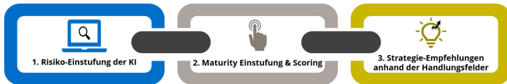
Phasen AI Act Assessment

Mit Hinblick auf den Artificial Intelligence Act wird dabei zusätzlich auch eine Risikobewertung entlang der mitgelieferten Standards durchgeführt, um eine etwaige Angreifbarkeit zu minimieren.