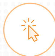
Click to call