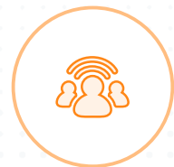
Groupes de sonneries