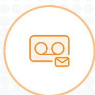
Messagerie vers email