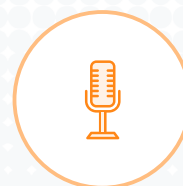
Enregistrements des appels