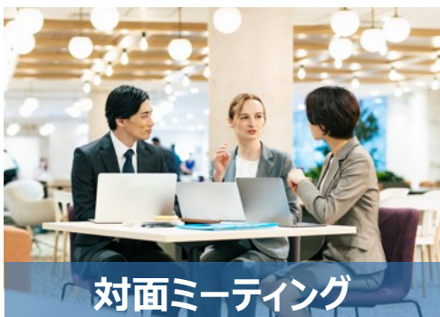
対面ミーティング