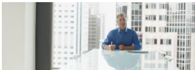
Solution de virtualisation classique locale (On-Premise)