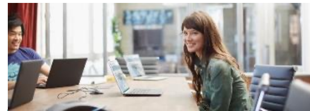
Solution Azure Virtual Desktop dans Azure