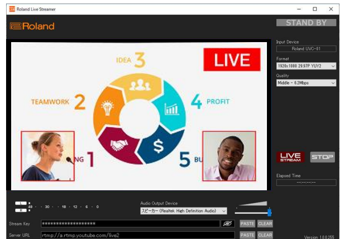
図 1 Roland Live Streamer の外観